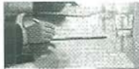
Check Paper Status