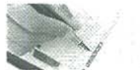
Download A-LIEP 2011 tentative program

Selected papers from the A-LIEP2011 Proceedings will be published by Elsevier as special issues of the journal International Information & Library Review , which is indexed in Scopus.