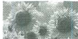
Venue & Accommodation