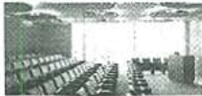
Call for Participants

HOME A-LIEP 2011 UPDATES CAMPUS ACCOMMODATION REGISTRATION ISCHOOL CALLS CONTACT US SITEMAP