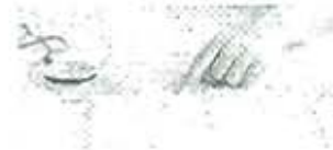
How to Get Here?